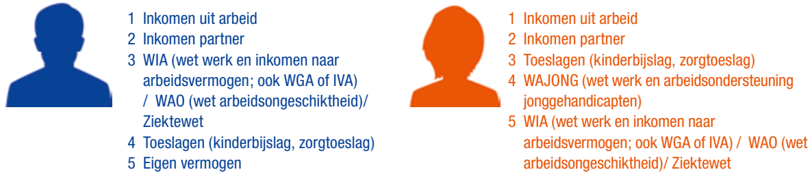
Figuur 6.2 Werk of dagbesteding

45% van de volwassenen heeft betaald werk, dus inkomen uit arbeid. Bij 38% van de mannen en 24% van de vrouwen is inkomen uit arbeid de belangrijkste inkomensbron. Het inkomen van de partner is voor 21% van de vrouwen de belangrijkste inkomensbron en voor 7% van de mannen.