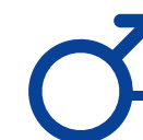
Fig. 1. Sectoren waar mannen (het liefst) werken

In de open antwoorden van vrouwen (genoemd onder ‘anders’) zie je duidelijke verschillen in sectoren waar vrouwen met autisme op dit moment werken, en waar zij het liefst willen werken. Op dit moment werken zij met name in de administratieve of zakelijke dienstverlening, terwijl hun voorkeuren uitgaan naar: iets met dieren/natuur, iets met techniek, communicatie, iets met boeken (redactie of vertalen) of iets creatiefs zoals fotografie of journalistiek.